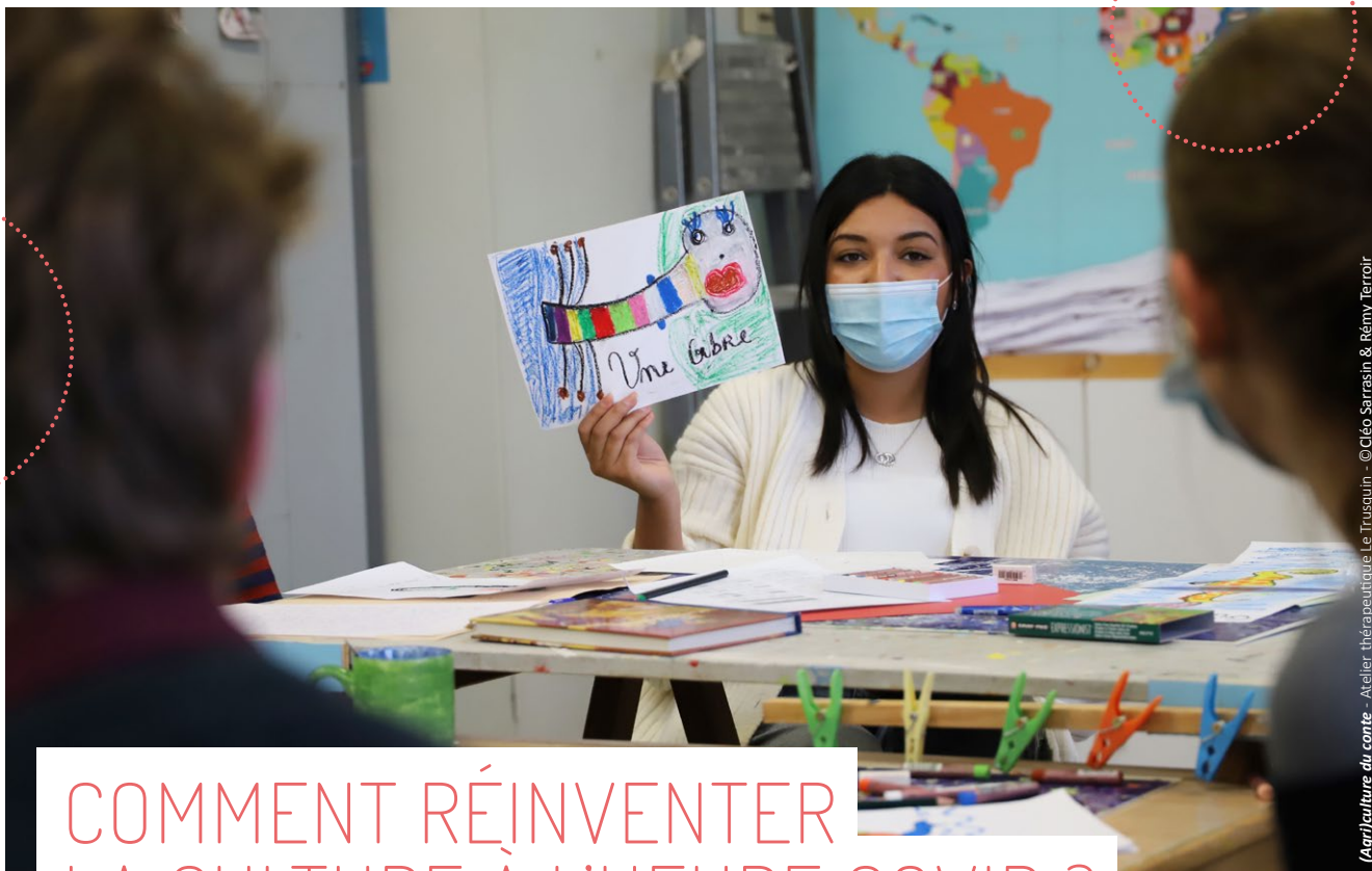
(Agriculture du conte - Atelier thérapeutique Le Trusquin