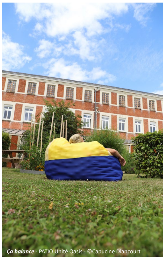
Ça balance - PATIO Unité Oasis