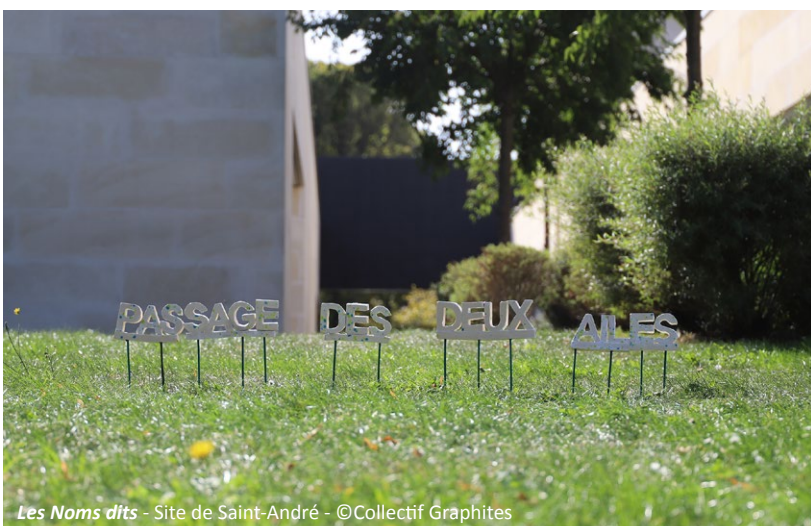
Les Noms dits - Site de Saint-André - ©Collectif Graphites