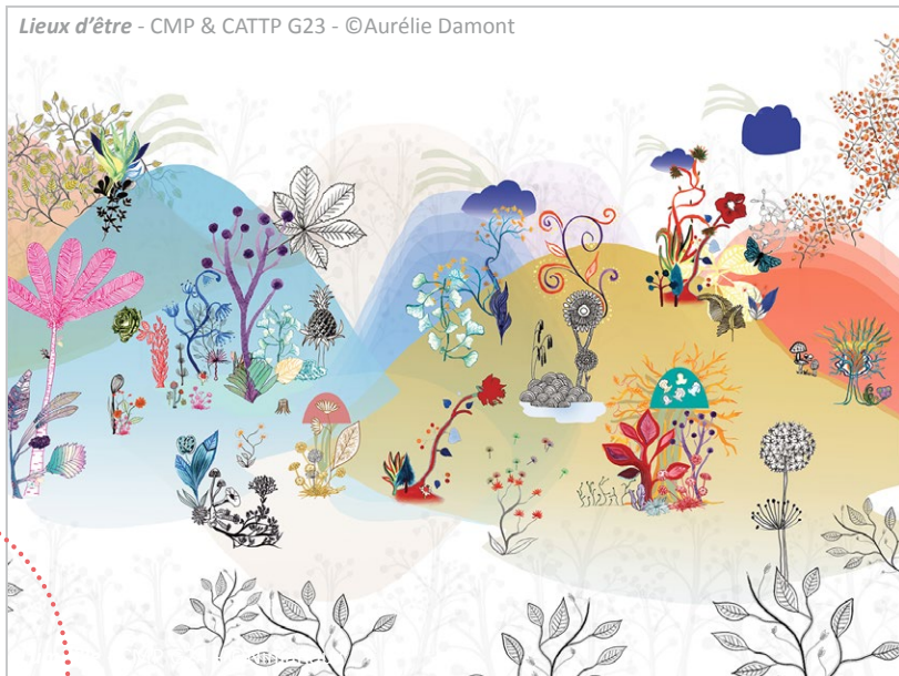
Lieux d'être - CMP & CATTG G23