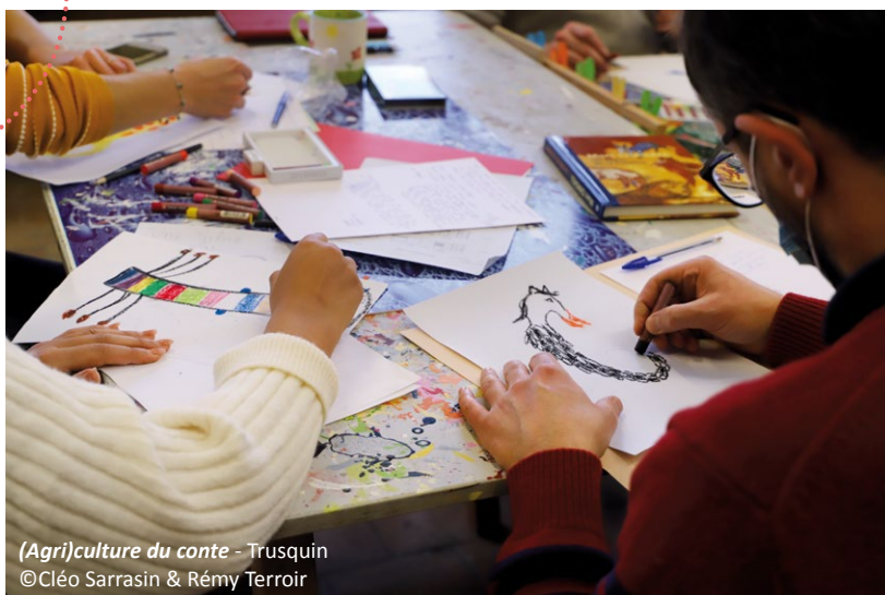
(Agriculture) culture du conte - Trusquin