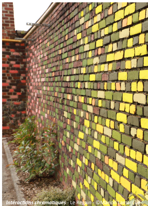
Intéactions chromatiques - Le Regain - ©Marion Lamarque